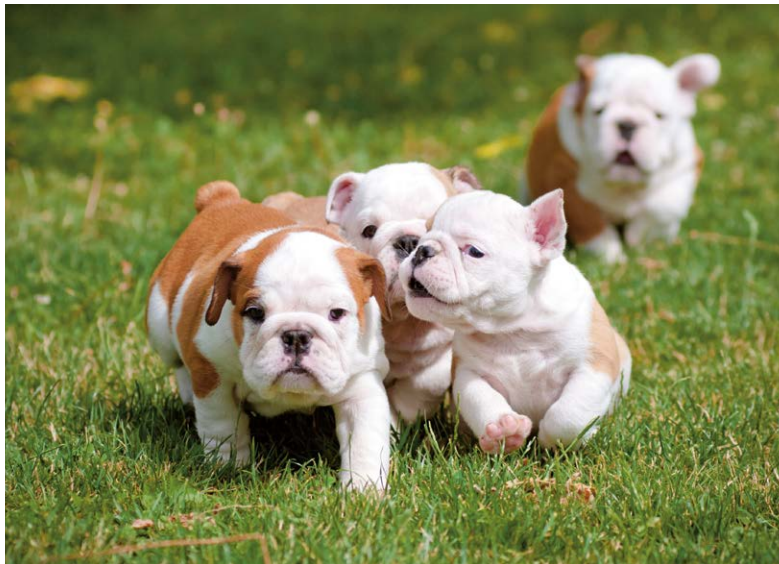
Ook de Engelse Bulldog valt onder de maatregelen.

De vraag dient zich aan of het misschien beter is de rashondenproblematiek los te koppelen van de hondencultuur, -hobby en -geschiedenis – kortweg "de kynologie". De showwereld claimt min of meer dat het veranderen van rassen hun exclusieve voorrecht is. De maatschappij vindt echter steeds meer dat zij het recht en de verantwoordelijkheid heeft om diergezondheid en -welzijn aan de kaak te stellen, en sociale media bieden daarvoor een uitstekend