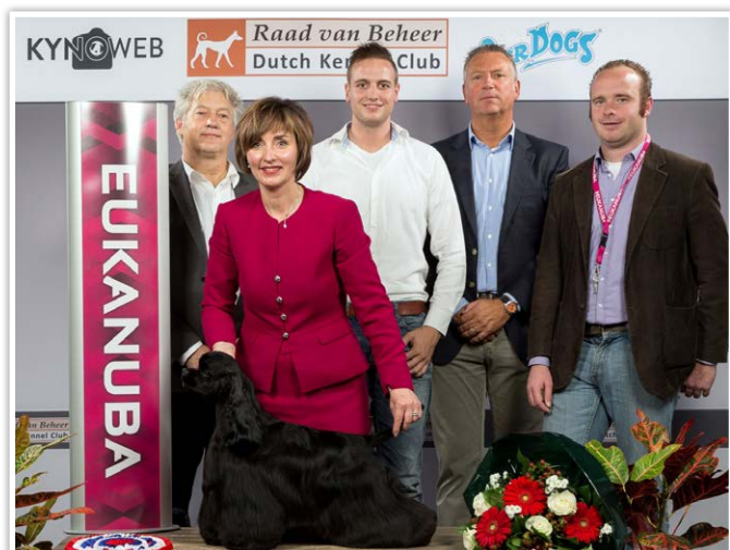
Chicomys Quite Sexy (hier in Maastricht) afgevaardigd naar Eukanuba World Challenge