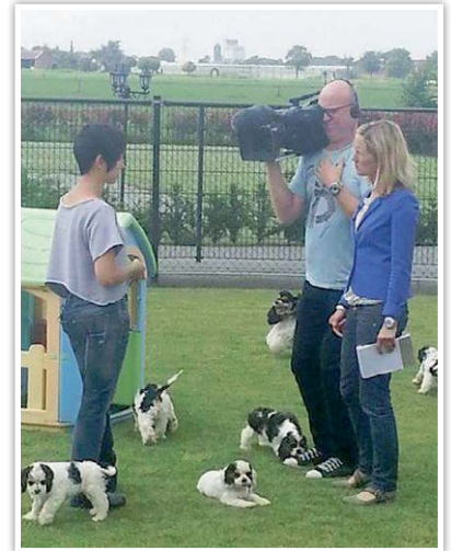
Massacommunicatie leent zich niet voor nuanceren.

niet altijd juist is. Doelstelling van de Raad van Beheer bij massacommunicatie is dan ook niet om een genuanceerd verhaal neer te zetten maar om te laten zien dat bij de Raad van Beheer, de rasverenigingen en de fokkers de gezondheid en het welzijn van rashonden altijd het belangrijkste zijn. In de massa-communicatie gaat het er om te laten zien dat de Raad van Beheer - en zijn leden en hun achterban - stappen zetten om de gezondheid en het welzijn van honden te verbeteren. Als dat beeld goed overkomt in de media, is de massacommunicatie voor de Raad van Beheer geslaagd.