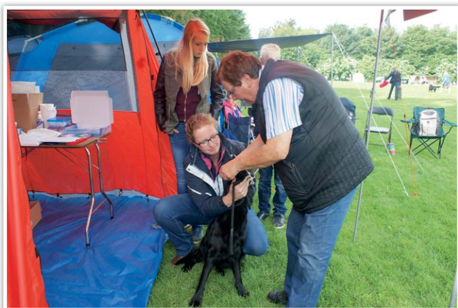
De chippers van de Raad van Beheer tijdens de DNA-afname.