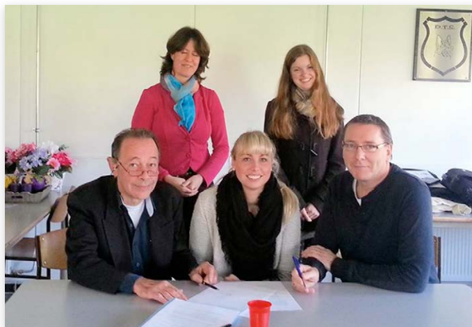
Het sluiten van convenanten met rasverenigingen om erfelijke ziekten uit te bannen, is onderdeel van het Fairfok-plan (2014).

Al eerder werden convenanten gesloten met de beide rasverenigingen voor de Engelse Bulldog en de rasvereniging voor de Cavalier King Charles Spaniel. Op zondag 1 november was het zover voor de American Staffordshire Terrier. De ASTCH en haar leden waren die dag bijeen en hebben ingestemd met het convenant. Dat kon derhalve ter plekke worden ondertekend!