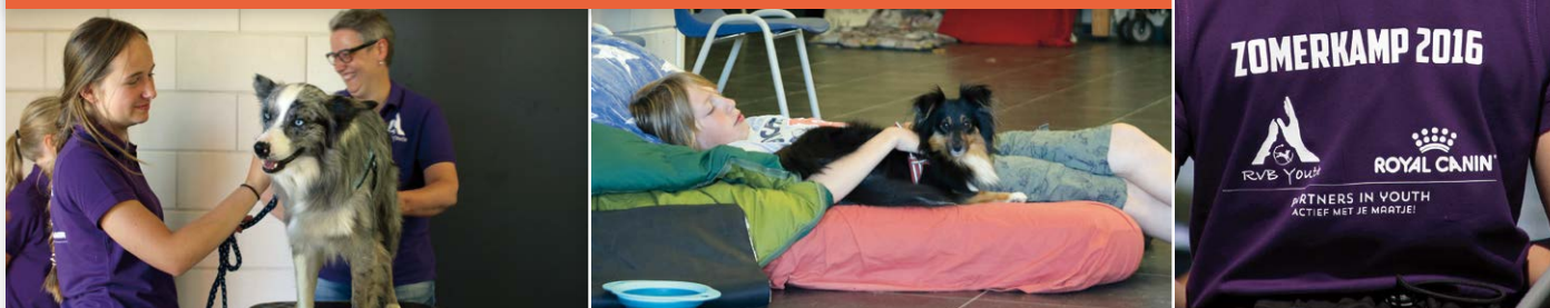
In de workshop Vachtverzorging leerden de kinderen veel over de noodzakelijk verzorging van de hondenvacht. Daarna was het even goed rusten...