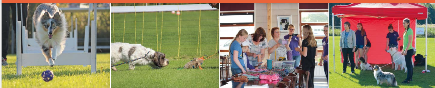
En nog meer activiteiten: vlnr Flyball, Jachttraining, riemen maken en showtraining...