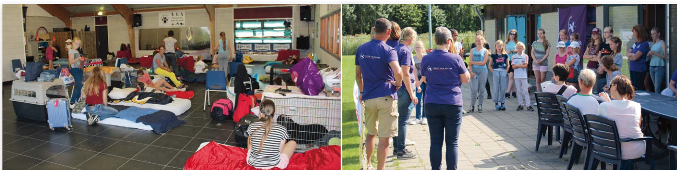
Op de drukke slaapzaal slapen kind en hond bij elkaar, bij aankomst wordt iedereen welkom geheten