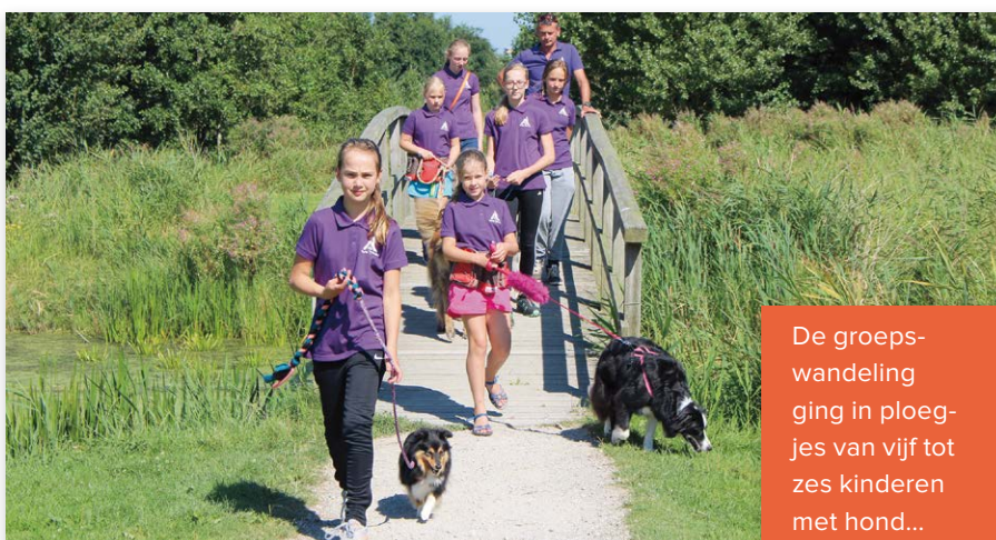
De groepswandeling ging in ploegjes van vijf tot zes kinderen met hond...