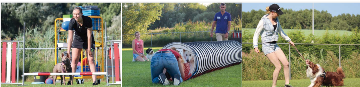
Het kamp zat vol workshops waarin de sporten goed aan bod kwamen. Hierboven tweemaal Agility en eenmaal FCI Obedience

Iedereen heeft veel geleerd, genoten, plezier gemaakt en nieuwe vriendschappen gesloten. Begeleiding en workshopgevers genoten van de samenwerking tussen jongeren en hun hond, de deelnemers konden snuffelen aan sporten die ze nog niet kenden. Moe, maar vooral voldaan ging iedereen bepekt en bezakt met een mooie goodiebag van onze officiële partner in Youth Royal Canin, gewonnen prijzen, de zelfgemaakte hondenriem en hondenspeeltjes weer naar huis – in afwachting van het Zomerkamp 2017.