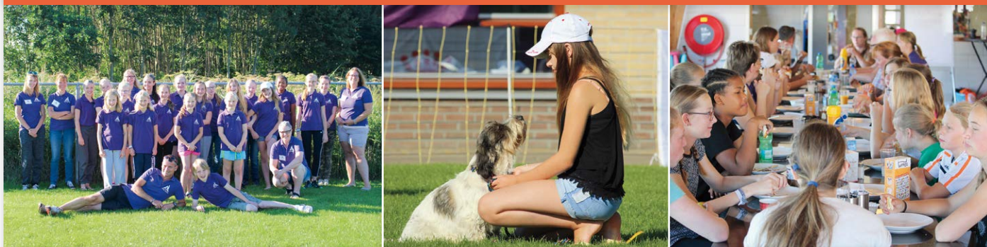
Groepsfoto met begeleiders, onderonsje tussen baasje en hond en een vrolijk ontbijt met de hele groep...