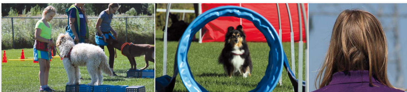
De kinderen genoten vervolgens van (vlnr) workshop Balans & Coördinatie en Hoopers