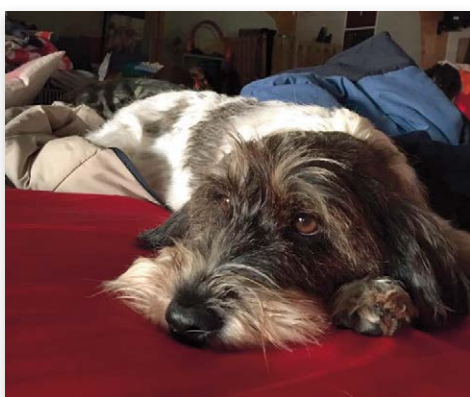
Even rust voor mijn baasje? Dan ga ik ook onder zeil...