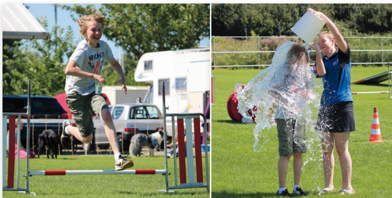
De waterestafette was een hoogtepunt en 'ontaardde' in een watergevecht...