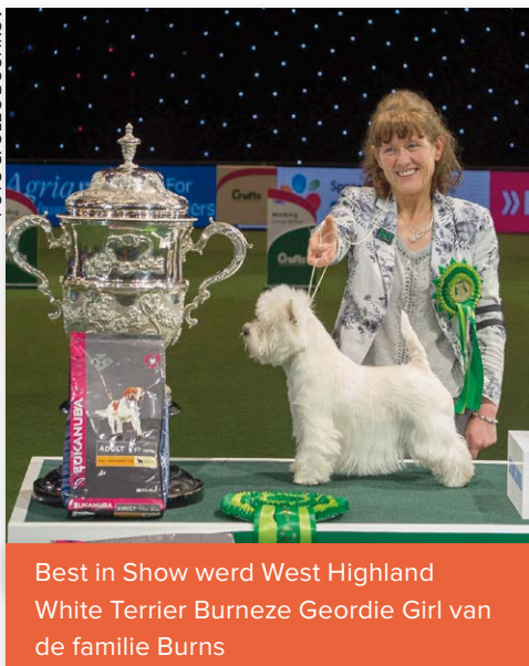
Best in Show werd West Highland White Terrier Burneze Geordie Girl van de familie Burns