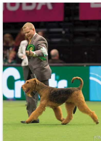
BOB Airdale Terriër Expression Factor-X of Malton, Eig.: J.M. Bouma & N. Pisani

In dit artikel foto's van "Nederlandse" honden die beste van het ras (BOB) zijn geworden. Veel Nederlandse honden hebben goed gepresteerd door zich sowieso voor de Crufts te plaatsen, maar ook door het winnen van hun klasse of van de kwalificatie "best opposite sex". We hebben niet van alles foto's en beperken ons tot de BOB's. Iedereen nogmaals van harte gefeliciteerd!