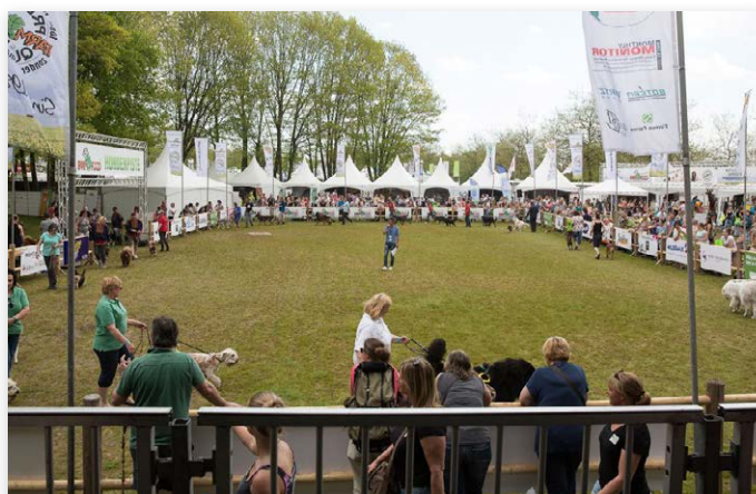
Met een uitstekend bezochte rashondenparade...