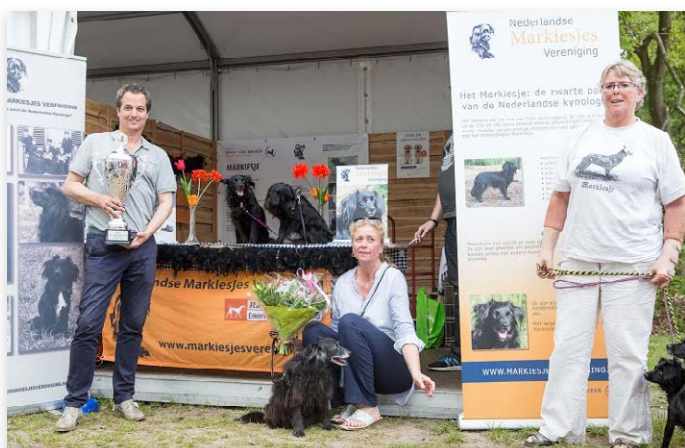
De stand van de Nederlandse Markiesjes Vereniging werd uitgeroepen tot 'Beste Stand'