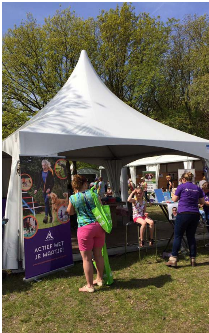
In de stand van Raad van Beheer Youth was van alles te beleven...