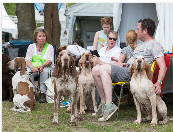
Met het mooie weer was het goed toeven voor de hele familie, inclusief de viervoeters!