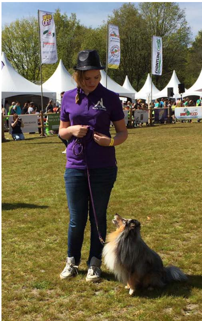
RvB Youth was prominent aanwezig en verzorgde diverse demonstraties