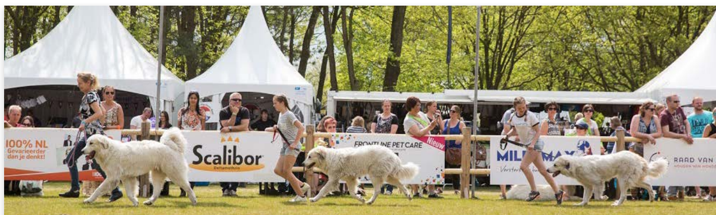
Met het prachtige weer zag het er bijzonder aantrekkelijk uit