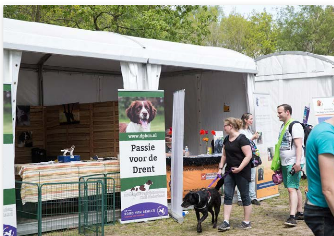
Alle aanwezige rasverenigingen deden goede zaken. Hier de stand van de Drentsche Patrijshonden Club Nederland (DPHCN)