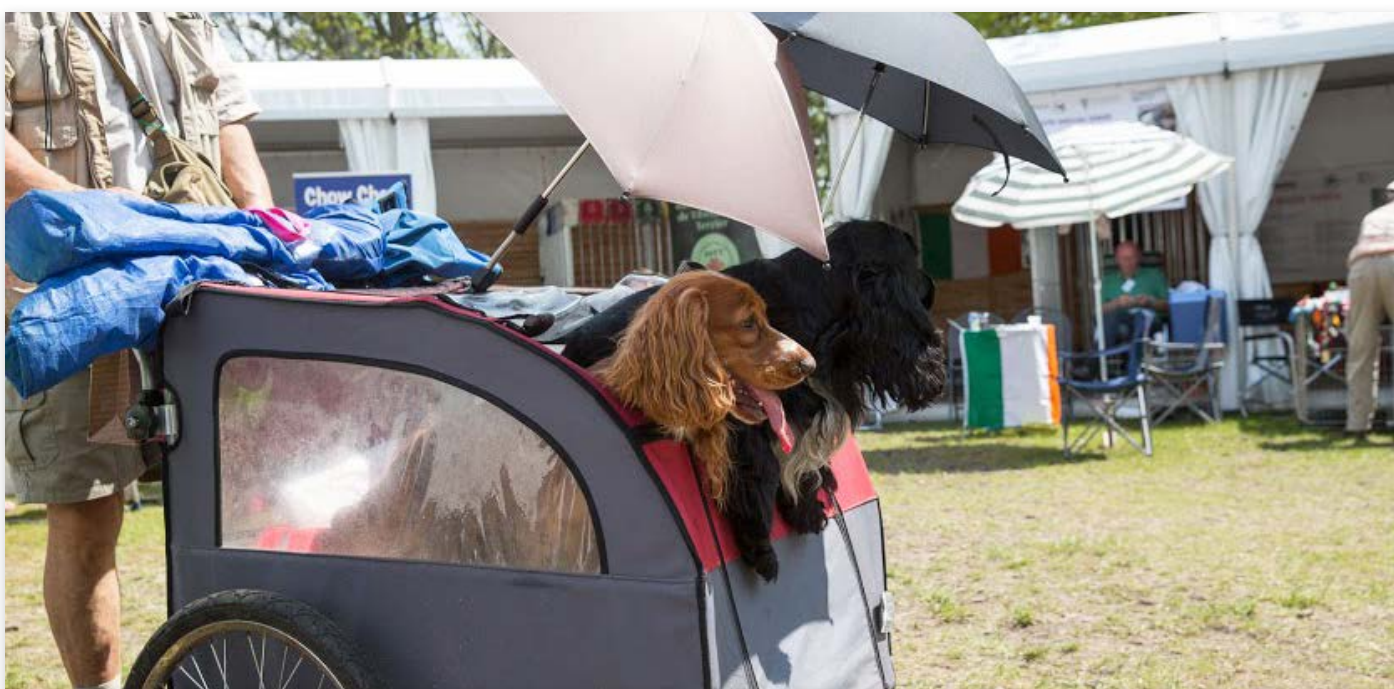
Zo kan het ook...