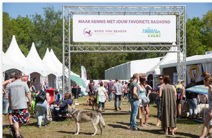
Het was drie dagen druk in onze Dog City, waar hondenliefhebbers helemaal aan hun trekken kwamen