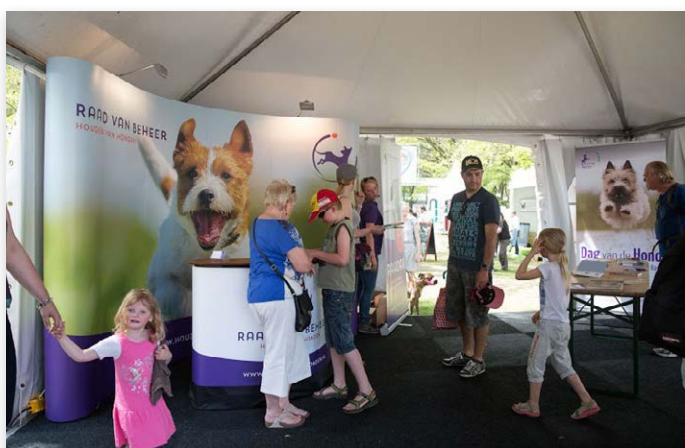
Veel aanloop in de stand van de Raad van Beheer