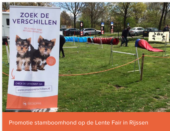
Promotie stamboomhond op de Lente Fair in Rijssen