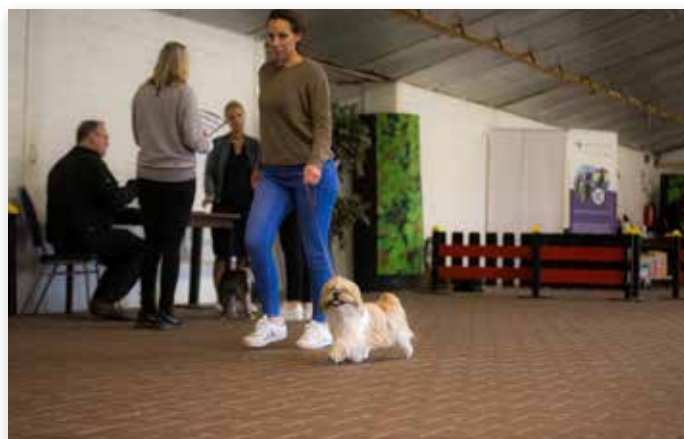
Enthousiast voor de looptest...