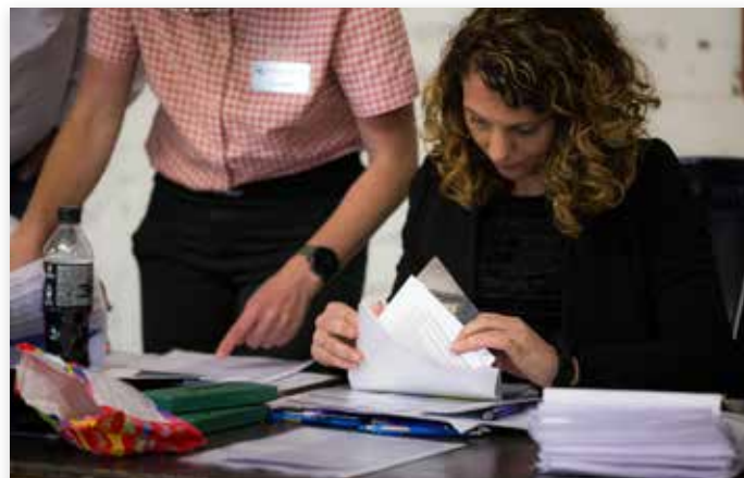
Natuurlijk moest er veel worden geregistreerd