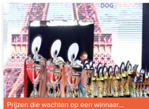
Prijzen die wachten op een winnaar...