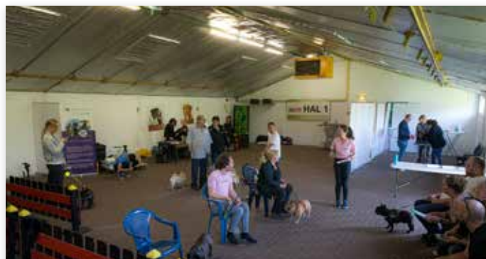
Om lange wachttijden te voorkomen kwamen de honden op afgesproken tijden