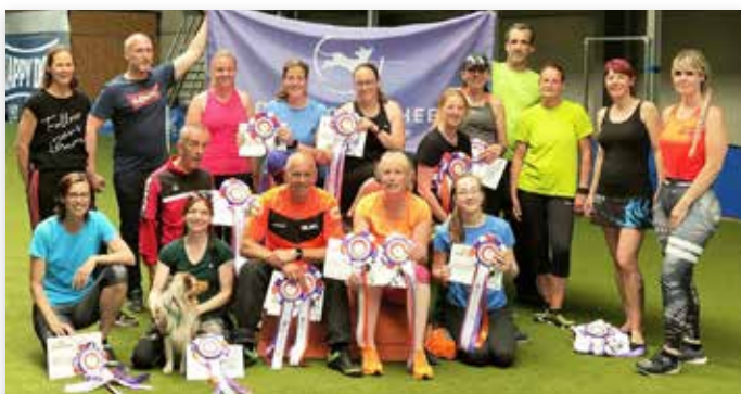
Dit is Team NL inclusief reserves

Meer informatie over het WK FCI Agility vindt u op www.awc2022.at