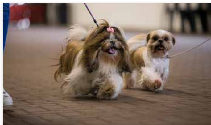
Vrolijke deelname aan de looptest

Bij alle rassen zijn er honden zonder een enkele aanwijzing van ademhalingsproblemen, maar ook honden met (kleine en grotere) problemen gevonden. Het was daarmee dus echt een dwarsdoorsnede van de populatie. Voor sommige eigenaren was de uitslag even schrikken, zij hadden niet verwacht dat hun hond