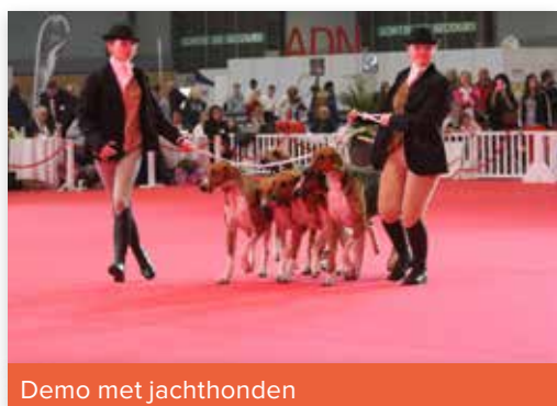
Demo met jachthonden