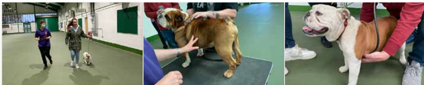
De te screenen honden werden voor en na de looptest nauwkeurig onderzocht en beluisterd...