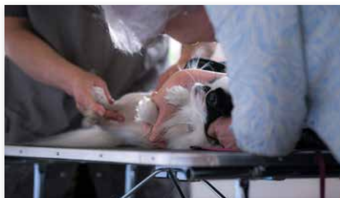
Check op patella luxatie bij Japanse Spaniel