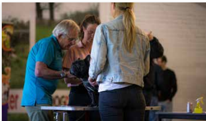
Zorgvuldig onderzoek van iedere hond