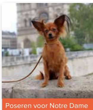
Poseren voor Notre Dame