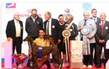
Best In Show...