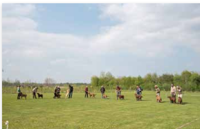
Er was veel animo voor deelname op deze mooie dag...