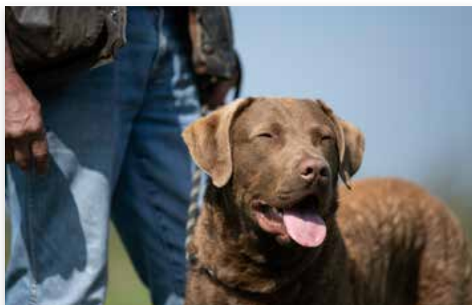
De honden kwamen uitgebreid in actie...

Op zondag werd de proeven nog eens dunnetjes overgedaan. Dat gebeurde tijdens de clubdiplomadag, waar ook leden met andere retrievers aan konden deelnemen. Het werd opnieuw een mooie en enerverende dag voor de leden en het bestuur, alsmede de grote groep van vrijwilligers die alles mogelijk maakten. Men kan tevreden terugkijken op een mooi weekend, waarbij de weergoden de jubilaris absoluut gunstig gezind waren.