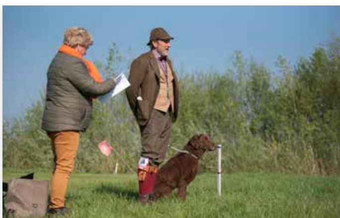
Instructies voor de jachtproef