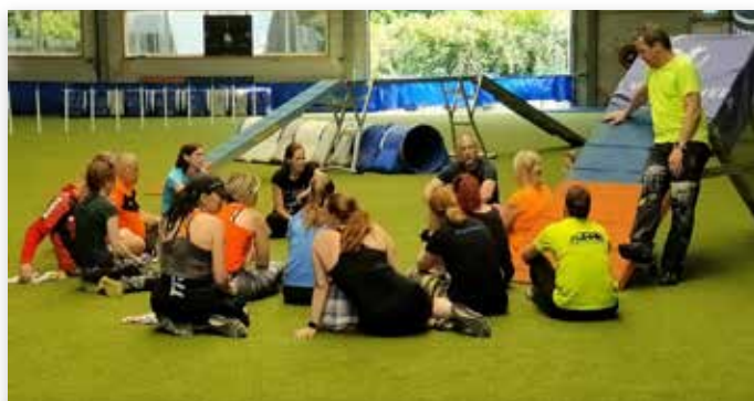
Eerste teambijeenkomst met de coach...