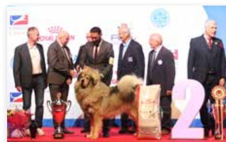
BIS Championnat de France