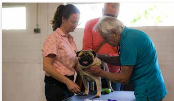
Luisteren naar ademhaling voor en na looptest