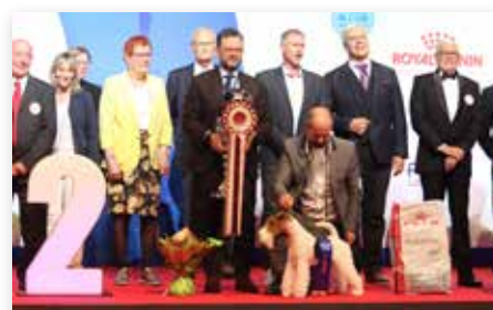
Reserve Best In Show