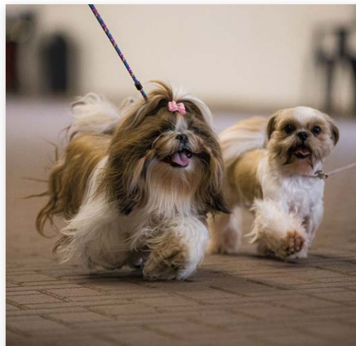
Shih Tzu tijdens looptest...

Op zondag 26 maart vond in het Dogcenter in Kerkwijk de tweede BOAS-nulmeting plaats bij honden die horen bij de brachycephale (kortsnuitige) rassen. In totaal zijn er 144 honden beoordeeld, onder meer om te zien of ze functioneel kunnen ademen. In 2022 deden we de eerste nulmeting bij 65 honden, wat het totaal brengt op meer dan 200 honden.