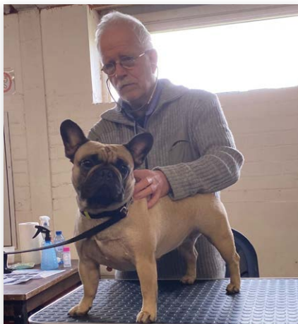
De honden worden voor en na de looptest beluisterd