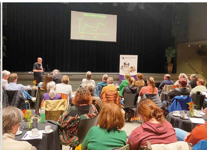
...en de volle zaal hangt aan zijn lippen