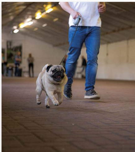
Mopshondje tijdens looptest...